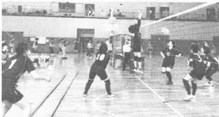
前回（2019年）の球技大会の様子